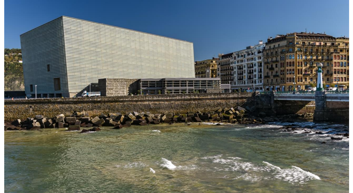
Palacio de Congresos y Auditorio Kursaal (siglo XX). (Autor: Jorge Franganillo).

Recinto cultural que se diseña accesible para todas las personas.