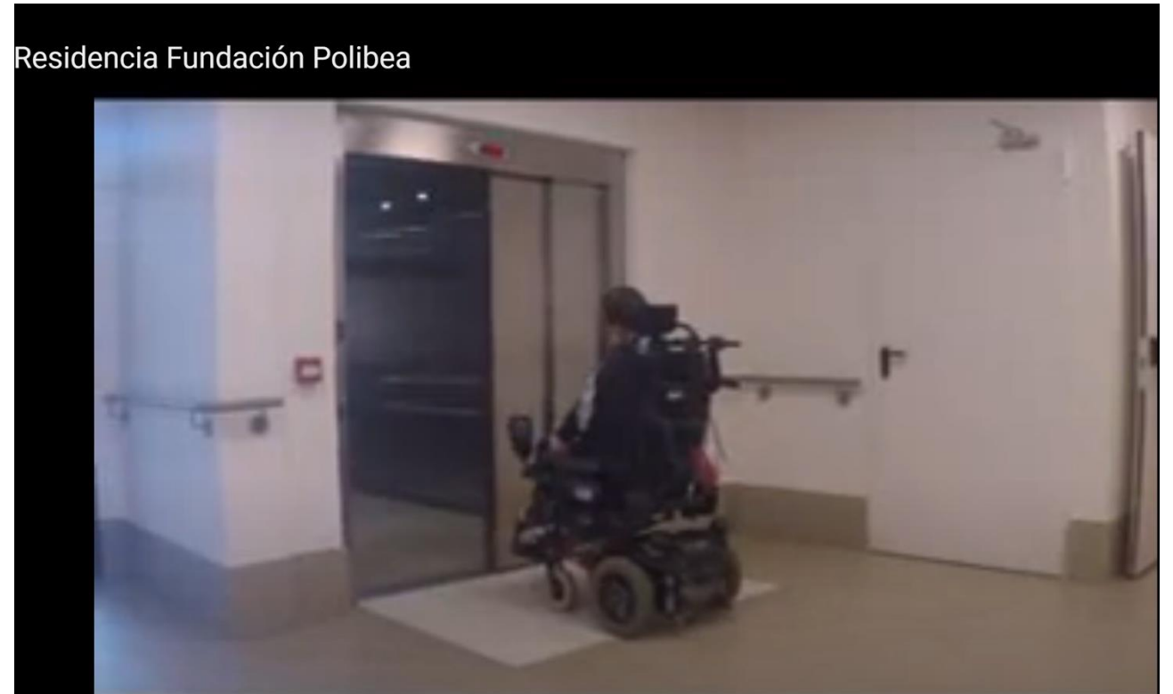
Persona con parálisis cerebral en silla de ruedas usando el ascensor gracias al sistema implantado, utilizando tarjeta NFC.

La tecnología debe ser desarrollada para que se pueda utilizar de una manera sencilla, adaptada a la persona usuaria.