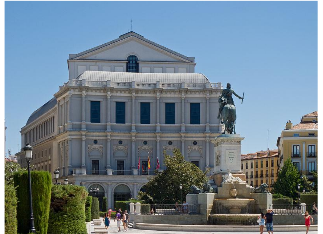
Teatro Real de Madrid (siglo XIX), fachada principal vista desde la plaza de Oriente. (Autor: Carlos Delgado).

Recinto cultural y artístico que se ha adaptado durante el siglo XXI para que sea accesible para todas las personas.